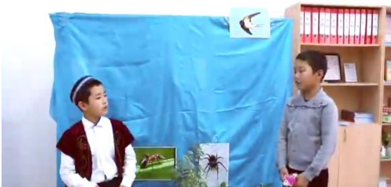
4 сыныпта «Қарлығаш, құмырысқа, өрмекші» әңгімесі желісіндегі сахналық көрініс

Ыбырай Алтынсарин – қаншама ғасырлар өтсе де, өзі өмір сүрген заманы мен өмірінде қазақ балаларына “Кел, балалар, оқылық” деп жар салудан тынбаған, сол арқылы қазақ балаларының надандық жолға түсуіне мүмкіндік бермеген, әр әңгімесі тәрбиенің алтын дінгегі болып саналатын өшпес дара тұлға.